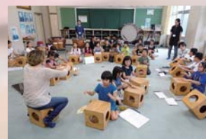
豊間ことばの学校 (夢の学び舎-いわき学校プロジェクト)