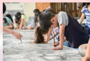
好間土曜学校 (夢の学び舎-いわき学校プロジェクト)